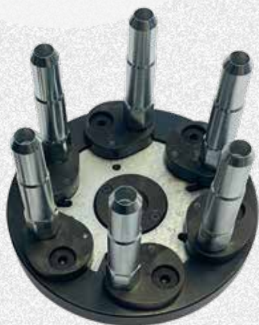
Versione per cerchi rovesci

In meno di 1 minuto si passa dalla versione per cerchi rovesci a quella per cerchi senza foro centrale, grazie alla sua struttura che contempla la duplice funzione senza la necessità di avere 2 differenti flange.