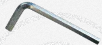
Chiave esagonale CH 10