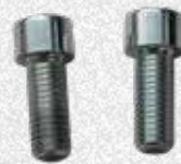
Viti per fissaggio