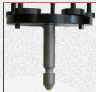
Bloccaggio manuale/ elettromeccanico