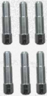
Colonnelle H 100 mm / 3.94"