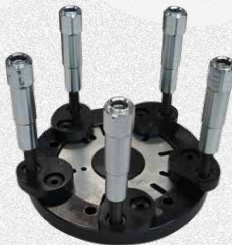
Set-up Cerchi senza foro centrale