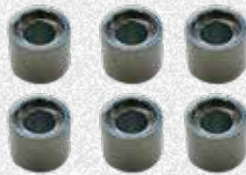
Distanziali H 20 mm / 0.8"

(min-max interasse - PCD: 95-183 mm / 3.7"-7.2")